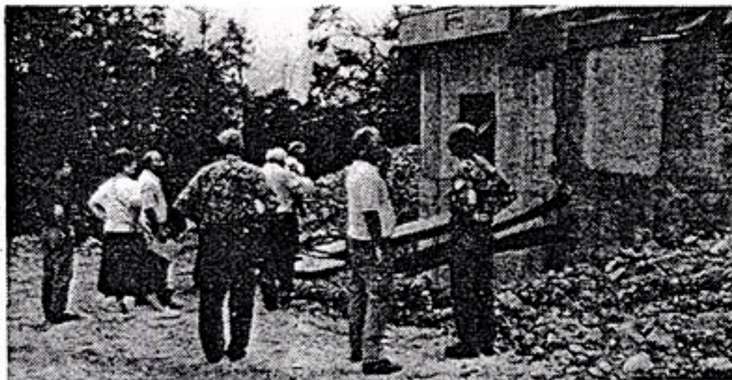
Qui sopra e sotto il titolo due momenti della visita dei consiglieri comunali di Magré e dei tecnici presso le sorgenti

I lavori in fase di ultimazione sul monte Roen